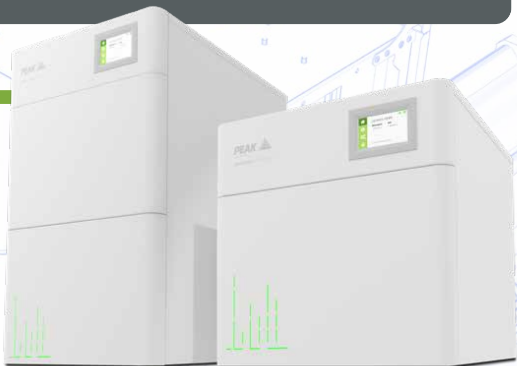
Genius XE 70

Deux modèles distincts répondent à vos besoins de débit : le Genius XE 35 (jusqu'à un total de 35 l/min) et le Genius XE 70 (jusqu'à un total de 70 l/min). Tous deux partagent de nombreux avantages, les différences se retrouvant au niveau des dimensions, du nombre de compresseurs internes (2 et 4, respectivement) et du débit de sortie total. Le XE 70 est idéal pour alimenter plusieurs instruments, comme 2 ou même 3 spectromètres de masse à partir d'une solution compacte.