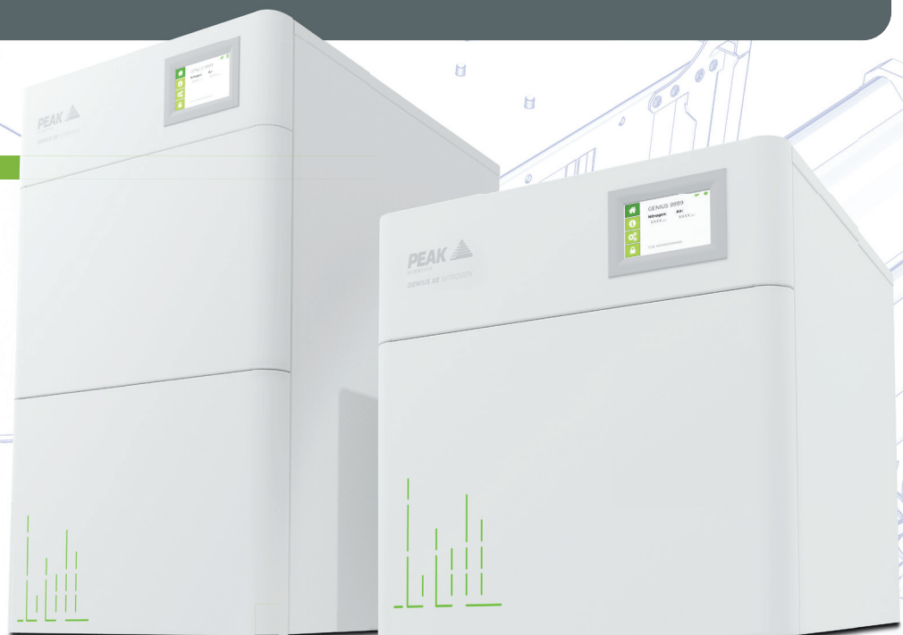
Genius XE 70

Zwei Modelle stehen Ihnen für Ihre Durchflussanforderungen zur Auswahl: Genius XE 35 (bis zu insgesamt 35 L/min) und Genius XE 70 (bis zu insgesamt 70 L/min). Beide zeichnen sich durch die vielen einzigartigen Produktvorteile von Genius XE aus und unterscheiden sich durch ihre Größe, die Anzahl der internen Kompressoren (zwei bzw. vier) und natürlich den Gesamtdurchsatz. Der XE 70 eignet sich für die Versorgung mehrerer Geräte, z. B. zwei oder sogar drei Massenspektrometer mit einer kompakten Lösung.